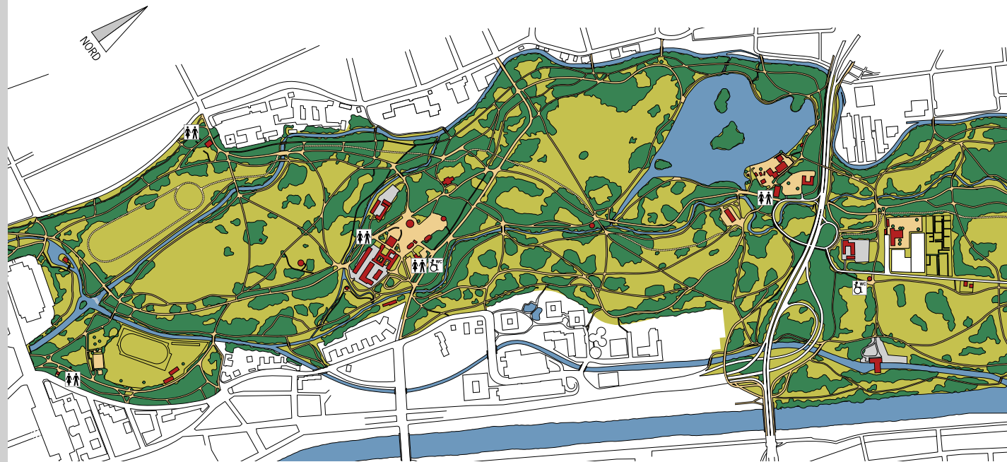
Toiletten (Die Öffnungszeiten der beiden Toiletten am Chinesischen Turm wechseln saisonal mit dem Biergartenbetrieb.)